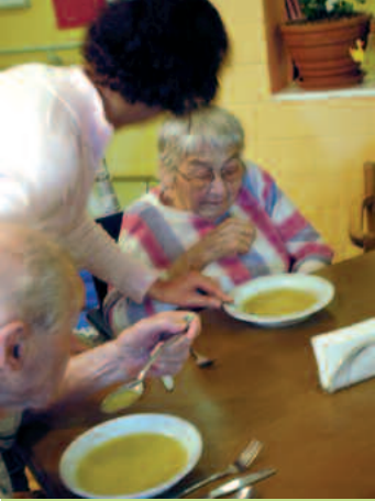
Ein würdevolles Altern dank professioneller Betreuung.