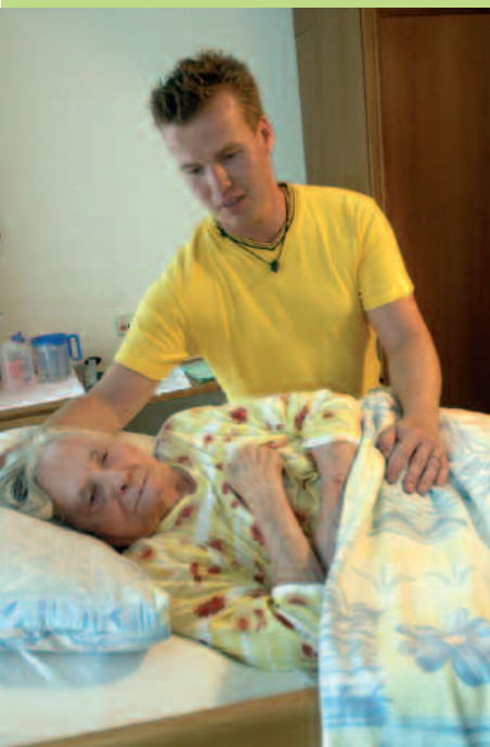
Auch Bewohner, die kaum noch oder gar nicht mehr aufstehen können, werden durch liebevolle Pflege und Betreuung in das Tagesgeschehen des Altenzentrums mit eingebunden.