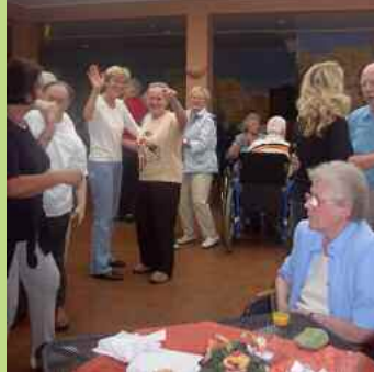
Immer sehr beliebt: unser Tanztee