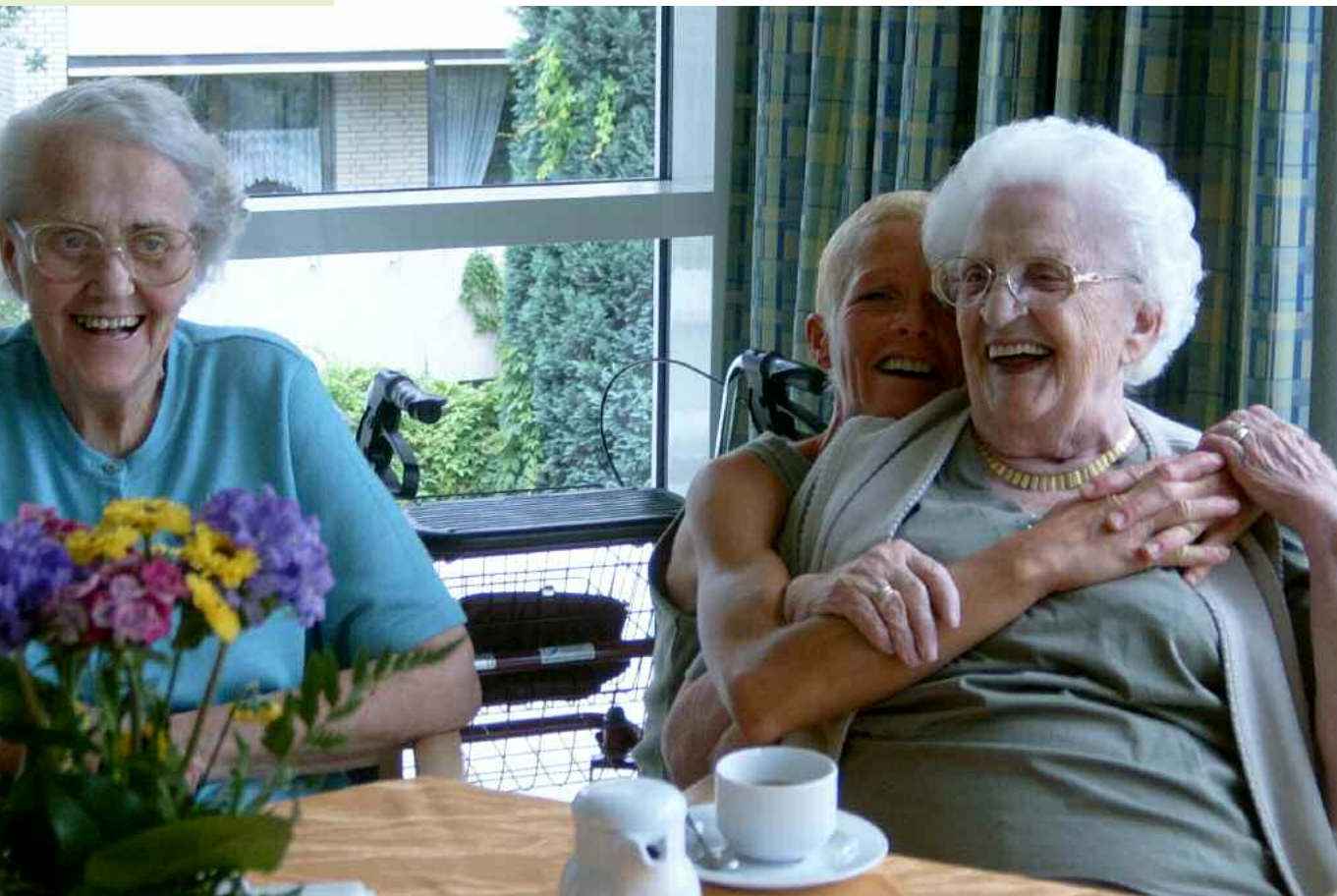
Herz ist Trumpf – auch im Altenzentrum Oedt.

dem dementiell Erkrankten ermöglicht, sich mitzuteilen und vorhandenen Stress abzubauen.