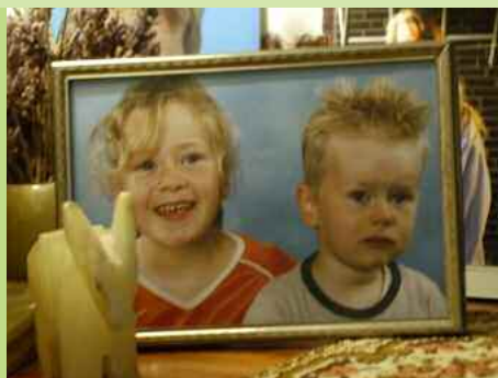
Auch all Ihre Lieben freuen sich mit Ihnen.

Bei uns im „Haus auf dem Heiderhof“ sind Sie umgeben von Ruhe und können dennoch die bunte Abwechslung genießen.