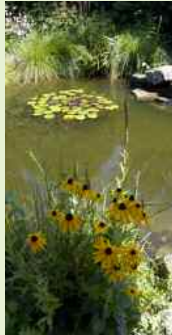
Das Altenzentrum „Xanten“ – ein idyllischer Platz zum Ausruhen.

Im Wohnbereich stehen Einzel- und Doppelapartements zu Ihrer Verfügung – ausgestattet mit eigener Küche, Dusche und WC, Balkon oder Terrasse und einem Notruf, der rund um die Uhr für Ihre Sicherheit sorgt. Alleine sein Vorhandensein ist Beruhigung pur. Gekrönt wird Ihr Wohnumfeld natürlich durch Ihre eigenen Möbel und andere lieb gewonnene Dinge.