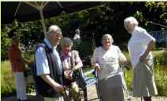
Im luftigen Halbschatten lässt sich die schöne Jahreszeit draußen herrlich genießen.

Im Altenzentrum „Haus am Stadtpark“ warten alle Vorteile eines eigenen Zuhauses auf Sie: Sie leben in Ihren eigenen vier Wänden, sind dort so unabhängig, wie Sie es wünschen und bestimmen Ihren Tagesablauf ganz allein. Hinzu kommen jedoch unschätzbare Vorteile, die Ihnen Ihr altes Zuhause nicht bieten kann: Modernste Einrichtungen für eine umfassende, ganzheitliche Versorgung und erfahrene, aufmerksame Mitarbeiterinnen und Mitarbeiter, die Sie in christlicher Nächstenliebe rund um die Uhr um Sie kümmern.