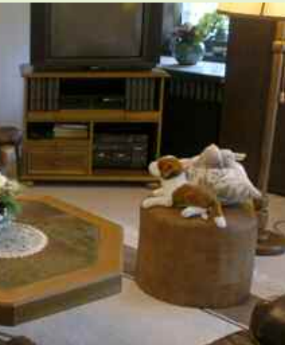
Genießen Sie das beschauliche Leben am Niederrhein.