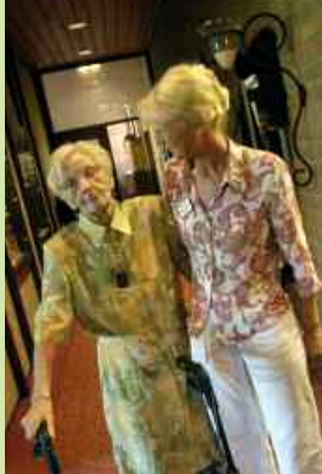
Wir unterstützen Sie stets in Ihrem Bedürfnis nach Selbständigkeit.

Unter Beachtung der Erhaltung größtmöglicher Selbständigkeit des Bewohners wird aufmerksam die Hilfeleistung erbracht, die ihm den Lebensalltag erleichtert und verbessert. Das Handeln unserer Mitarbeiterinnen und Mitarbeiter ist hierbei Ausdruck unseres christlich-diakonischen Selbstverständnisses, das sich an Würde und Wert des Menschen ausrichtet und von tiefer Nächstenliebe geprägt ist.