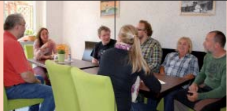
Gespräche führen ...