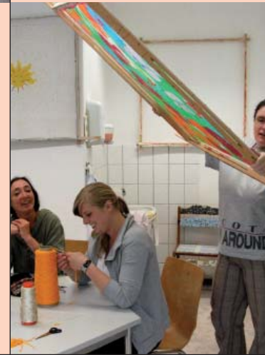
Schönes gestalten ...