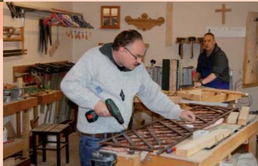
mit Holz arbeiten ...

So fördern wir Ihre Stärken, helfen Ihnen, in einem geschützten Umfeld, Herausforderungen anzunehmen und mehr Selbstvertrauen zu gewinnen.