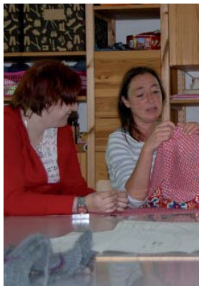
Textilien gestalten und pflegen ...